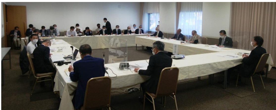
全自無連第61回通常総会（東京・都市センターホテル）