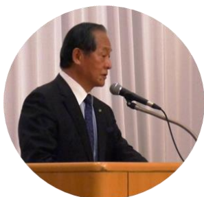
閉会挨拶をする漢副会長

審議・採決の結果については、全ての議案について意見・質問等の発言はなく、提案どおり決議・承認されました。