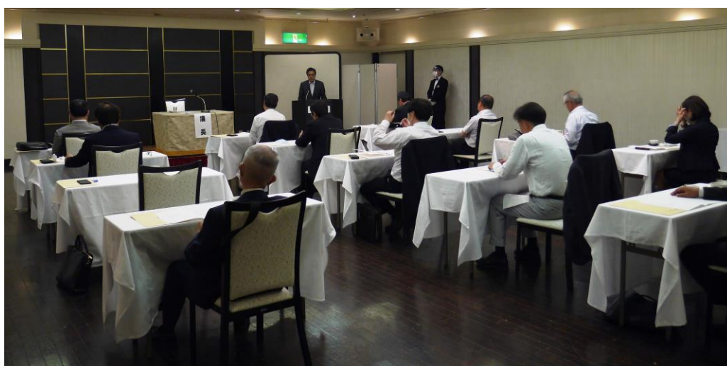
ソーシャルディスタンスでの総会模様