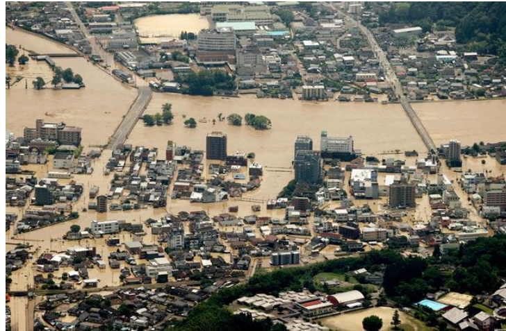
球磨川が氾濫し冠水した人吉市街地

被災地では懸命の復旧作業が行われていますが、長引く雨と新型コロナウイルス感染防止のためのボランティア受け入れ制限等から作業はなかなかはかどらず、かなりの日数がかかる見通しです。