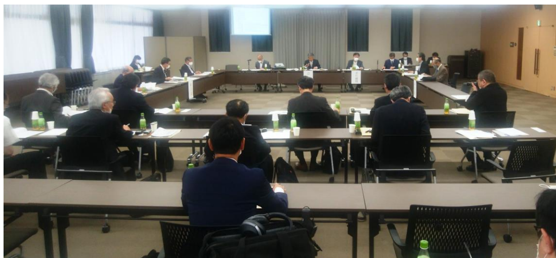
全自無連通常総会（東京・自動車会館2階大会議室）

なお、当日は総会に先立ち「臨時正副会長会議」が、総会後には「臨時全国専務理事会議」が開催され、10月10日（土）に熊本市で開催予定の秋の正副会長会議（フォーラムを含む）の内容や今後の全自無の在り方等について議論が交わされました。